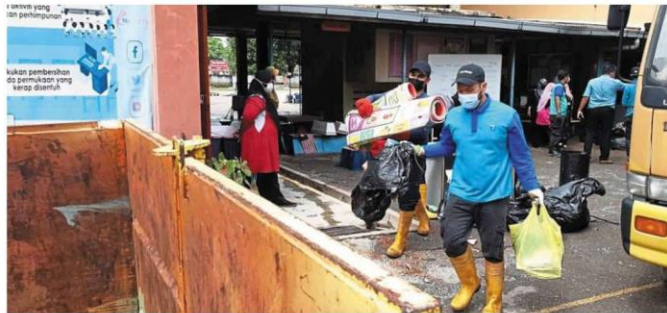
Volunteers throwing away rubbish from a school during the clean-up.