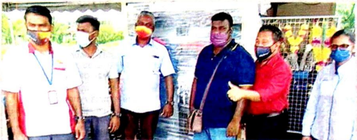
Ahli Dewan Undangan Negeri Sabak, Ahmad Mustain Othman (dua dari kanan) bersama Unit Penyelaras i-Seed menyerahkan bantuan peti sejuk kepada penjual bunga di Sabak Bernam.

Beliau berkata, Unit I-Seed juga berjaya melalui rintangan dan menepati janji untuk menyerahkan bantuan kepada pemohon meskipun negara dilanda Covid-19.