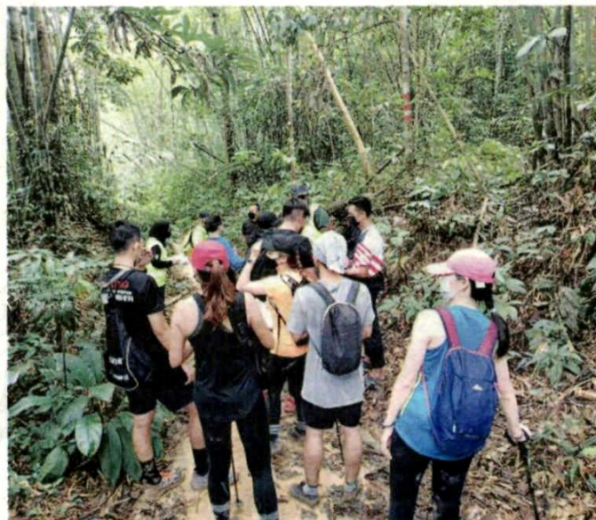
KAKITANGAN JPNS mengambil butiran sebahagian daripada 16 pendaki kerana memasuki HSK Bukit Kutu tanpa permit sah kelmarin.

Pada 25 September lalu, JPNS turut menahan 56 individu yang mendaki di Air Terjun Setinggi, Hutan Simpan Serendah tanpa kebenaran.